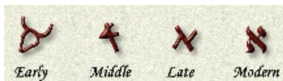
Пиктограмма Ктав Иврит Ктав Ашурит Книжный Шрифт

Б уква «АЛЕФ». Справа, она показана в форме пиктограммы.