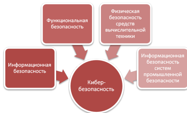
Рисунок 3. Схема формирования кибербезопасности

Для более точного определения представим кибербезопасность как следствие обеспечения ряда видов безопасности, представленных на рис. 3.