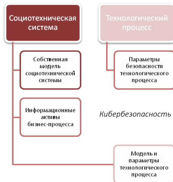
Рисунок 1. Виды информации при управлении технологическим процессом

Представляется целесообразным разделить всю информацию, обрабатываемую в социотехнической системе на четыре категории: