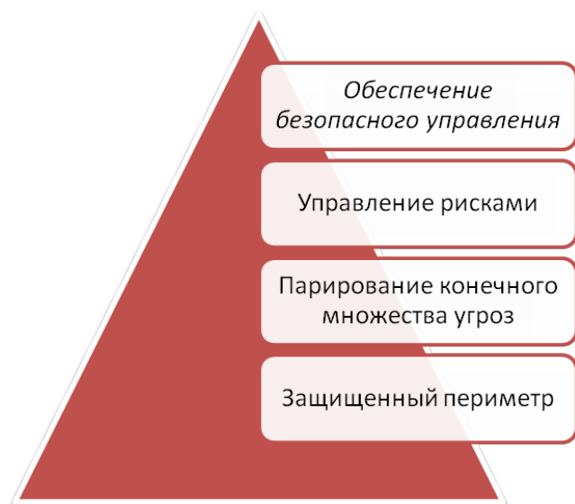
Рисунок 2. Схема концептуальных подходов к обеспечению информационной безопасности

В этом случае формируемый подход может быть вписан в существующую систему подходов в соответствии со схемой, представленной на рис. 2.