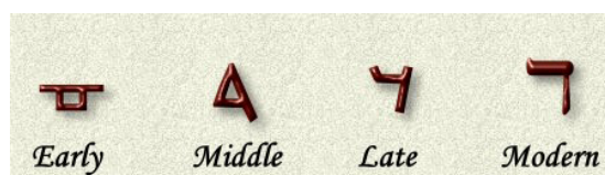
Пиктограмма Ктав Иври Ктав Ашурит Книжный Шрифт

Эта буква интересна тем, что она неполноценна в своем значении. Эта четвертая буква в алфавите, так что она связана с числом «четыре».